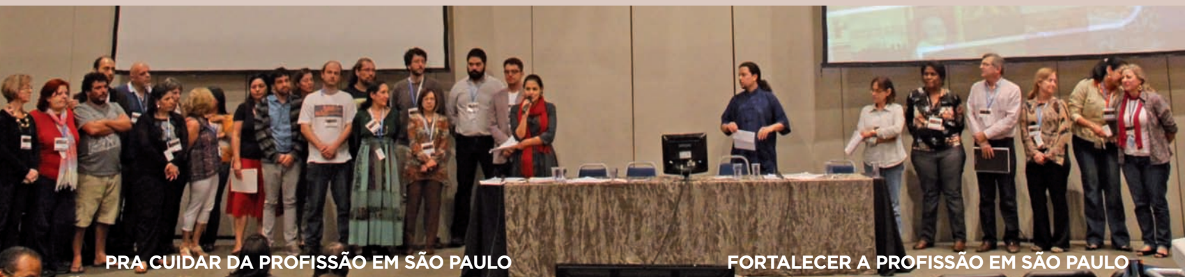
PRA CUIDAR DA PROFISSÃO EM SÃO PAULO

cólogos (as) que fazem parte de cada uma delas, e acompanhe este processo na área destinada às eleições no site do CRP SP na internet: www.crpsp.org.br/eleicoes/