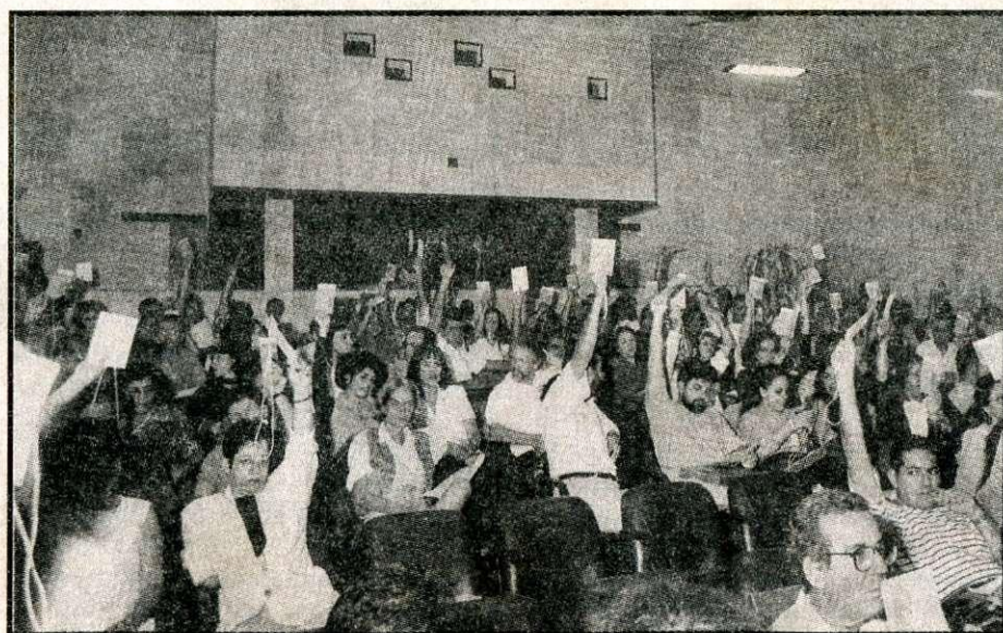
Psicólogos decidem no voto as ações dos conselhos para os próximos dois anos

A necessidade de revogação da Resolução do Conselho Federal 029/95 foi consenso entre os participantes dos grupos de sistematização (o tema foi discutido por dois grupos). A decisão foi acatada pelo plenário que definiu o