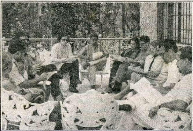
Durante o Congresso, delegados reuniram-se para discutir sucessão no Conselho Federal de Psicologia e apresentar as chapas que concorrem ao pleito de 28 novembro. Ao lado, reunião da CHAPA 1 - Consolidação Nacional. Acima, reunião da CHAPA 2 - Um Conselho para Cuidar da Profissão.

Um dos principais pontos alterados na Lei 5.766 foi a forma como será organizado o Fórum de Entidades. De acordo com o texto aprovado, o Fórum continuará composto por todas as instâncias de organização da psicologia, mas como um órgão independente do Conselho Federal. O que o plenário considerou, nas discussões sobre o Fórum, foi que a forma como estava funcionando, ligado ao Conselho Federal, acabou por permitir ingerências na autarquia.