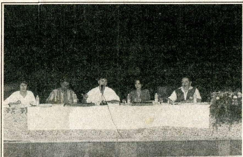
II Congresso Nacional da Psicologia SESC - Venda Nova - BH

Delegados reúnem-se em Belo Horizonte e decidem diretrizes políticas para enfrentar problemas da profissão. Págs. 8 e 9