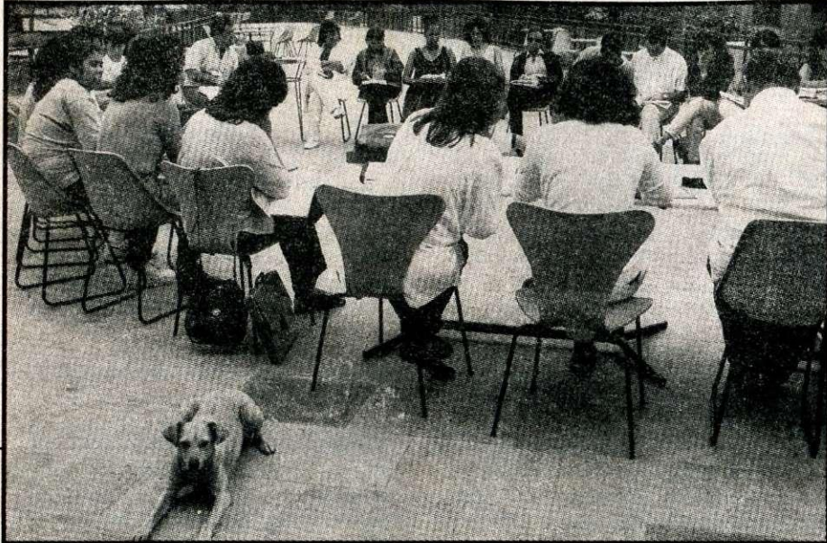
Discussão sobre práticas alternativas no grupo de sistematização

final do primeiro semestre de 1997 como prazo para edição de nova resolução, orientando os psicólogos sobre o tema. A elaboração da nova resolução, no entanto, deverá ser precedida de ampla discussão com a categoria. Para isso será criado um Fórum de Debates com a categoria a partir de novo eixo de discussão: prática alternativas e a produção do conhecimento para a psicologia. Esse Fórum será composto por dois representantes de cada Conselho Regional e do Conselho Federal.