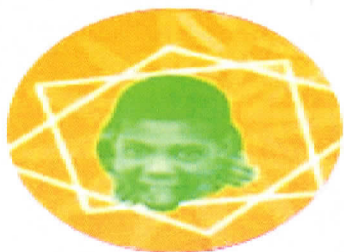
Manifesto CRP/06 -SP