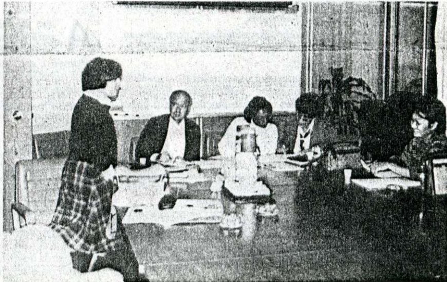
Integrantes do Fórum de Saúde de São Paulo.