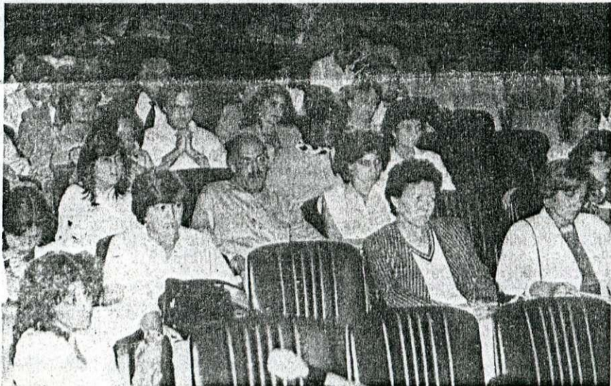
Os participantes do debate Saúde e Constituinte, no auditório do Senac.