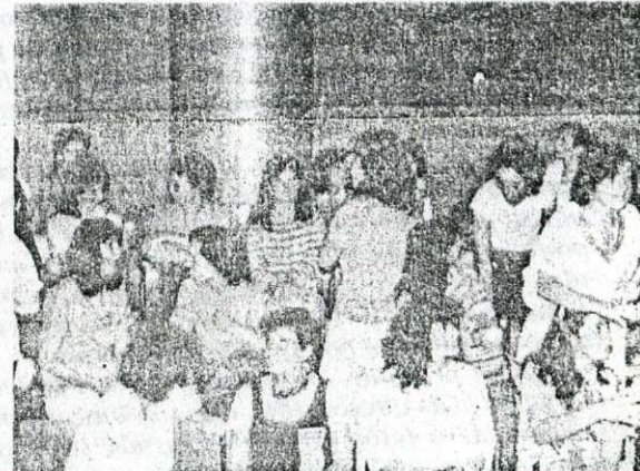
Cerca de 400 psicólogos estiveram presentes nos cinco dias do seminário