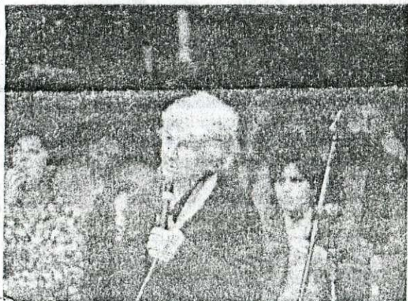
Presentes jovens e velhos psicólogos das Instituições da Promoção Social