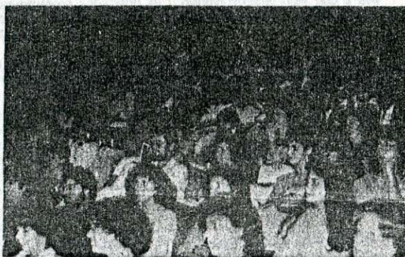
O debate no auditório do Instituto Sedes Sapientiae

1. Participar dos debates convocados pelos Conselhos, Sindicatos, Associações e demais entidades da categoria.