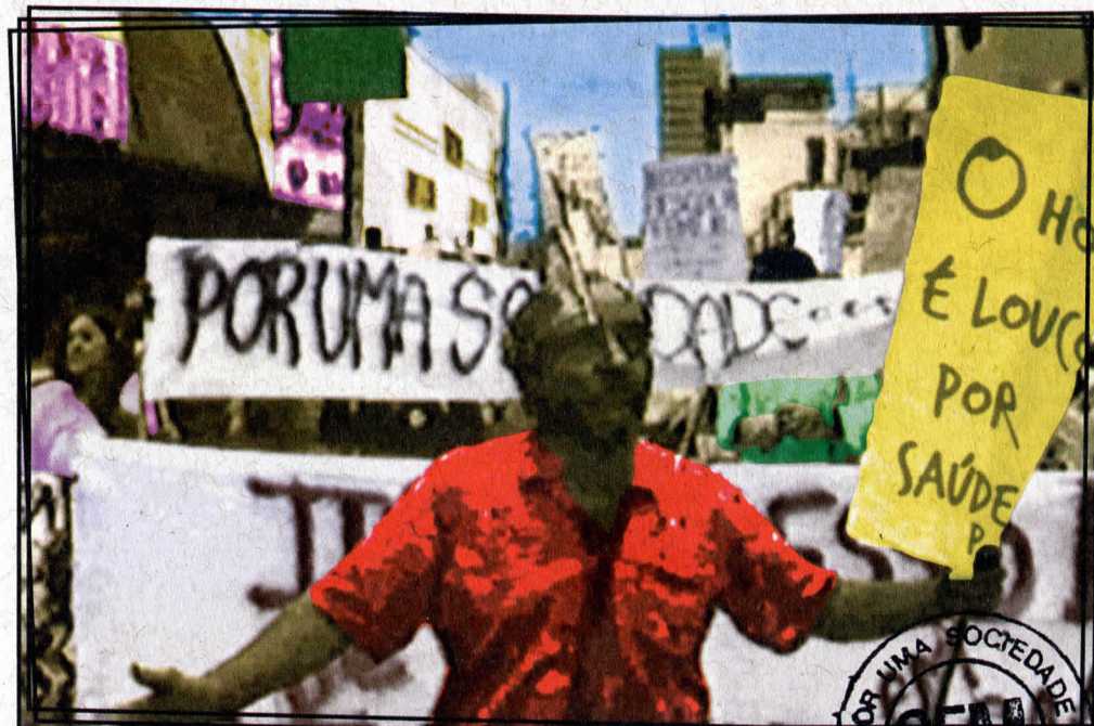
MANIFESTAÇÃO PÚBLICA CONTRA OS MANICÔMIOS NO BRASIL - BAURU, DEZ. 1987

RENILA - Rede Internúcleos, MNLA - Movimento Nacional, SESC/Bauru, Unip/Bauru e USC/Bauru